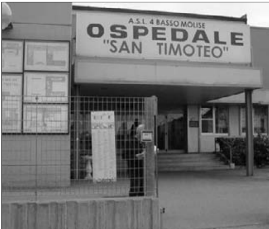
Il cancello d'ingresso dell'ospedale San Timoteo di Termoli

Scherzi a parte e aborrita l'idea di qualche parente serpente, il rettile si è ricoverato, è proprio il caso di dire, in un bagno al primo piano, chissà se avesse qualche bisogno impellente da sbrigare e, approfittando che nei servizi igienici non vi fosse nessuno, è partita la caccia dei pompieri, in tenuta catturandi. La vipera è stata adescata e agguantata quando si stava rintanando sotto un lavabo. Nessuna cruenta uccisione, ma il trasferimento in aperta campagna, dove l'esemplare è stato liberato. Più repentino nella fuga, la vipera avvistata nella filiale del Monte dei Paschi di Siena a Montenero di Bisaccia, dove alle prime avvisaglie, il rettile se l'è data a gambe, forse timorosa di essere additato come serpente rapinatore... in questo caso, nonostante l'allarme lanciato, l'intervento dei vigili del fuoco non si è reso più necessario.