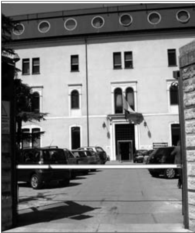
La sede dell'Asrem a Campobasso

CAMPOBASSO. Una goccia nel mare, certo. Se si pensa che il bilancio complessivo della sanità molisana è di 650 milioni di euro l'anno, è evidente che il milione che si risparmierà in seguito alla nuova stretta sulle consulenze, decretata il 2 agosto dal commissario Iorio, è poca cosa. È però un segnale dei tempi che corrono.