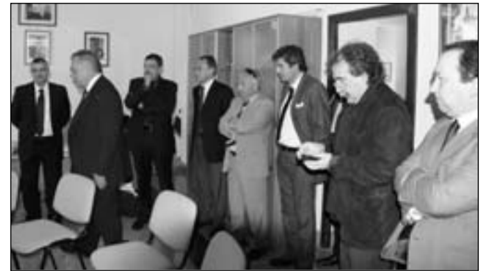
Il governatore Iorio nella riunione con gli amministratori

periodi l'ospedale San Francesco Caracciolo sono il frutto di una crisi demografica che da decenni investe in maniera drammatica tutto il territorio. Nonostante questa sia una zona disagiata ed esista una legge sulla montagna (mai applicata, purtroppo) che dovrebbe tutelare chi vive sulle nostre montagne -ha aggiunto il Consigliere- la diminuzione della popolazione, unita ai parametri moderni in materia di sanità, non giustifica più il mantenimento del nostro presidio ospedaliero così come esso è stato concepito per tanti anni. Bisogna tuttavia considerare che se l'Alto Molise, che attualmente conta circa tredicimila residenti, avesse gli stessi standard demografici degli anni '50 (circa trentamila residenti), oggi non saremmo costretti ad affrontare il problema del Caracciolo perchè tale struttura servirebbe ad un'utenza quasi tre volte maggiore. Nel lungo periodo, quindi, il futuro del territorio e il superamento del problema sanitario passano necessariamente attraverso una seria programmazione, su base quinquennale o