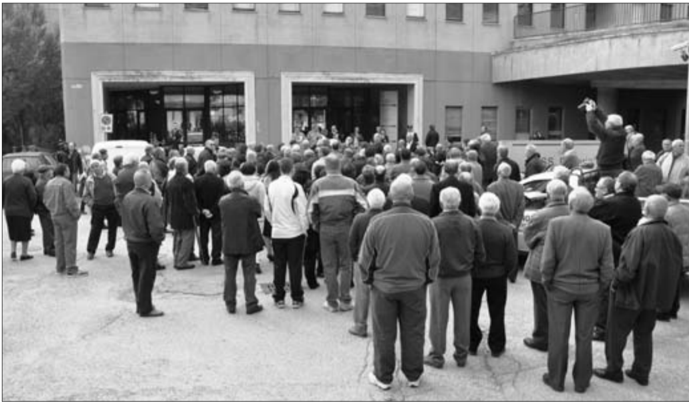
Un centinaio appena i venafрани che hanno risposto all'appello del comitato “Santissimo Rosario”

Solamente in 100 rispondono all'appello del comitato. Assenti il sindaco e la maggioranza