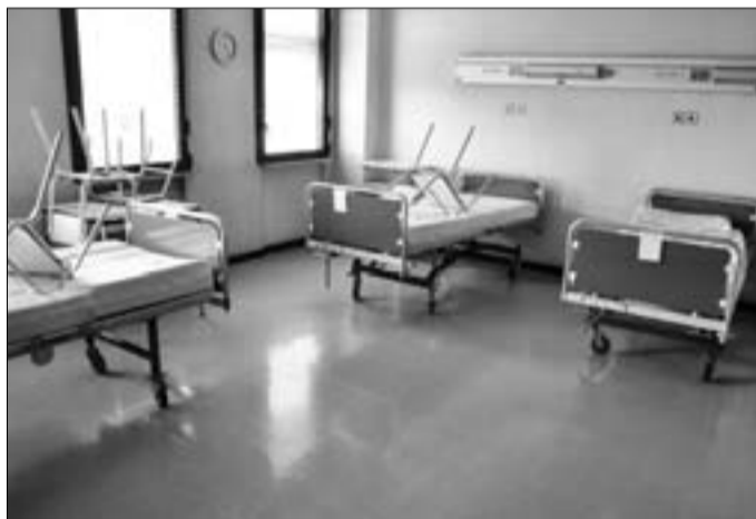
Letti vuoti nei reparti

gli. Lo stesso presidente del comitato, visibilmente deluso dalla mancata risposta della gente, ha desistito anche dall’intento di formare un presidio permanente all’ingresso della struttura. Gli effetti del piano di “riordino” sono così riassumibili: Chirurgia generale passa da 20 posti letto ordinari a 2 posti letto di day surgery; Medicina generale passa da 35 posti letto ordinari a 2 posti letto ordinari, e da 4 posti letto di day hospital a 2 posti letto di day hospital; Terapia intensiva resta con 2 posti letto tecnici di terapia intensiva post operatoria; Ortopedia passa da 24 posti letto ordinari a 16 posti letto ordinari più 2 posti letto di day surgery; Astanteria resta con 2 posti letti; Riabilitazione con 28 posti letto ordinari più 2 posti letto day hospital. Il pronto soccorso diventa punto di primo soccorso.