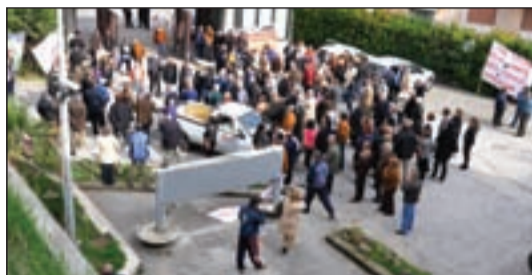
servizio a pagina 9

Scarsa l'adesione all'incontro indetto dal comitato pro ospedale Assente anche il sindaco, gli attivisti hanno rinunciato al presidio