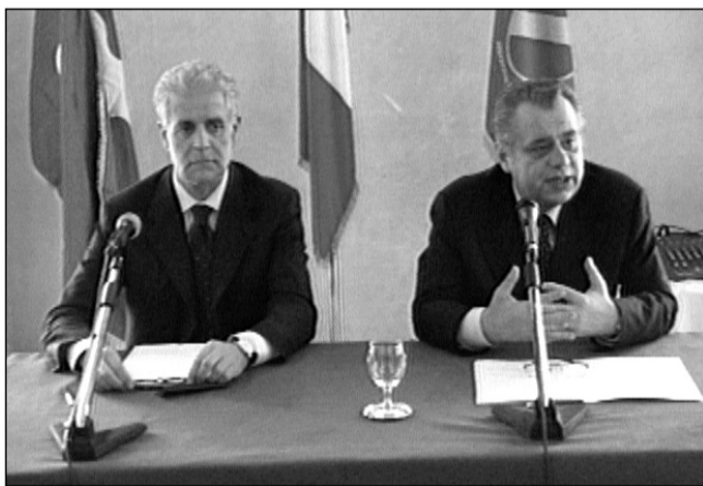
Roberto Formigoni e Michele Iorio

Le Regioni che in sanità hanno un bilancio in rosso "stanno facendo pagare ai propri cittadini tasse in più", tra cui "un'Irap assolutamente altissima". Lo ha detto il presidente della Lombardia Roberto Formigoni, a margine di un incontro per parlare del modello regionale di valutazione dell'efficacia ospedaliera. Un richiamo anche al Molise che è tra le regioni con un debito consistente in sanità. Formigoni ha ricordato che l'efficienza del sistema sanitario lombardo attira pazienti anche da altre Regioni: "Attiriamo pazienti dal resto dell'Italia - ha spiegato - che venendo in Lombardia hanno una speranza di essere curati migliore purtroppo che nelle loro Regioni di provenienza. Non è un caso se i cosiddetti 'viaggi della speranza' vengono nella maggior parte dei casi proprio dalle Regioni inadempienti", come Puglia, Basilicata, Molise e Calabria. "Sono purtroppo Regioni che non funzionano - ha aggiunto - almeno dal versante sanità. Hanno finanziamenti a volte anche superiori ai