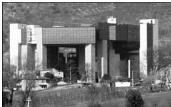
Le premiazioni si sono svolte presso l'università di Cassino