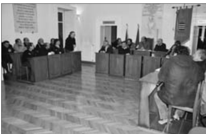
Voto unanime in Consiglio comunale

VENAFRO. Consiglieri uniti, come non si vedeva da tempo, nella difesa del Ss. Rosario. Nonostante l'ampia e accalorata discussione, alla fine tutti i consiglieri, della maggioranza e delle minoranze, hanno approvato all'unanimità un documento che, sostanzialmente, chiede la piena salvaguardia dell'ospedale cittadino. “Il Consiglio comunale (in premessa, ndr) chiede - si legge nella delibera -: alle autorità sanitarie regionali preposte di non togliere alcun mattone dalla precaria impalcatura che attualmente sorregge l'ospedale, con la certezza che se ciò avvenisse il nosocomio scomparirebbe”; e “che il Ss. Rosario venga liberato dal gioco dell'ospedale di Isernia (non si può infatti distruggere un ospedale per favorirne un altro) tanto più ora che anche Isernia non è Asl”. Insomma, un duro documento votato dall'intera assise civica che inoltre apre ufficialmente lo scontro con il “Ferdinando Venezia-”.