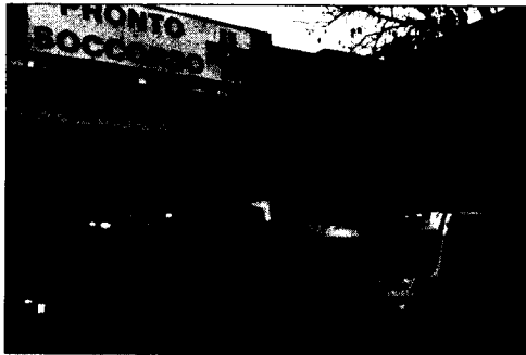
L'ingresso del pronto soccorso

I dipendenti: i pazienti se la prendono con noi perché non riusciamo a curare tutti