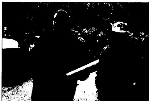
La conferenza stampa di ieri mattina