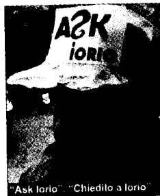
"Ask Iorio". "Chiedilo a Iorio"