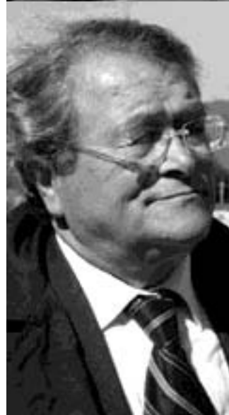
di Maurizio D'Ottavio

CAMPOBASSO - «Ladri, ladri, ladri ci state rubando il nostro futuro».