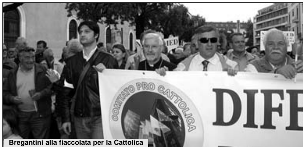
Bregantini alla fiaccolata per la Cattolica

"Questa non è la vittoria di una parte ma l'affermazione della sanità di qualità"