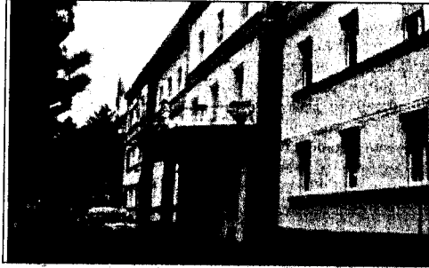
L'ospedale di Agnone

Quanto detto lascia intendere che per i punti nascita operanti in zone montane il limite di 500 parti l'anno è solo