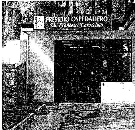
L'ospedale San Francesco Caracciolo di Agnone

più di un anno lavoro nella accogliente cittadina di Agnone e così ho avuto occasione di conoscere il presidio ospedaliero Francesco Caracciolo per eseguire accertamenti clinici presso il reparto di Medicina generale con conseguente ricovero e intervento operatorio in quello di Chirurgia generale. Le frequenti problematiche di salute del mio contorno familiare mi hanno dato l'opportunità, mio malgrado, di conoscere diversi aspetti del Ssn pubblico e privato in vari contesti regionali e conseguentemente ho accumulato un bagaglio di esperienze e di opinioni in merito. Nella struttura ospedaliera di Agnone e proprio per diretta esperienza, ho potuto apprezzare la qualità di un servizio che si costrui-