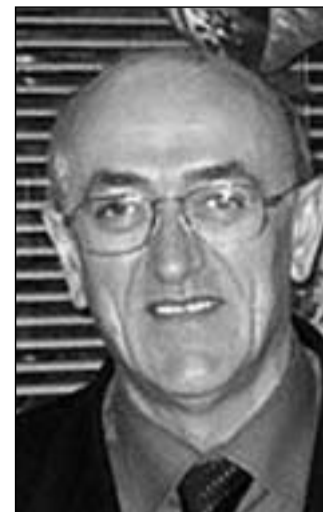
Il sindaco Monaco

blemi veri della sanità molisana, oggetto quotidiano di confronto - scontro. C'è all'orizzonte lo spauracchio dell'aumento dell'addizionale regionale Irpef, dell'Irap, dell'utilizzo dei fondi Fas per ripianare il deficit sanitario. C'è il concreto pericolo del taglio di servizi vitali, il che porterà inevitabilmente al declino definitivo delle nostre comunità, perché si avrà un ulteriore spopolamento del nostro territorio e si raggiungerà il nefasto obiettivo di far perdere le ultime speranze che ancora animano i pochi giovani rimasti a vivere nella nostra terra. Mi permetto di lanciare ancora una volta un allarme, un richiamo a coloro il quale hanno responsabilità di governo, ad ogni livello, affinché si possano a breve definire le sorti del nostro futuro e si accantoni l'idea di trascinarci ancora per qualche anno in una agonia annunciata, smentita, riproposta, parzialmente ritratta-