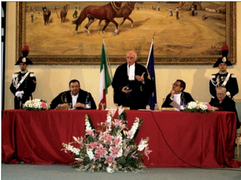
Un momento dell'intervento del Presidente della Corte dei Conti Raffaele Squitieri