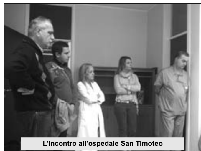
L'incontro all'ospedale San Timoteo

la raccolta e il prelievo del sangue cordonale nelle rispettive sale parto degli ospedali con il coinvolgimento dei centri trasfusionali e la successiva tipizzazione delle cellule staminali nella banca del cordone ombelicale presente al Gemelli di Roma. Importantissimo, a detta dei presenti, avere a disposizione donatori di cellule staminali in