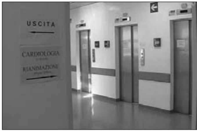
I tre ascensori fuori servizio nell'atrio dei reparti

ISERNIA. Ragione vuole che denunciare un disservizio serva a porvi rimedio; ma le regole della ragione, a quanto pare, non valgono per l'ospedale Veneziale di Isernia. Annosa ormai la questione inerente agli ascensori non funzionanti, ma il problema resta lì, fermo al palo. L'atrio principale del nosocomio pentro presenta ben tre ascensori, di cui uno non è accessibile ai visitatori, un altro reca scritto a caratteri cubitali "fuori servizio", il restante è dunque l'unico adibito al trasporto degli utenti (che negli orari di punta sono costretti ad attendere in fila) ma versa in condizioni fatiscenti: ormai vecchio, con il tappetino di gomma completamente rialzato a prova di "inciampo". Basta poi girare l'angolo e spunta un altro ascensore, si tratta di una sorta di montacarichi (per giun-