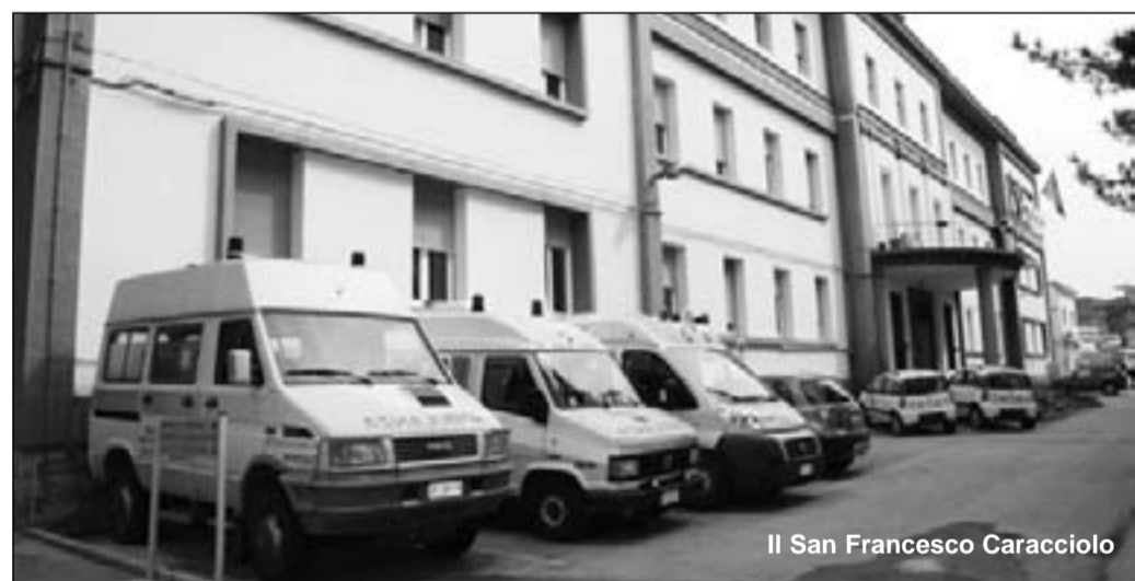
Il San Francesco Caracciolo