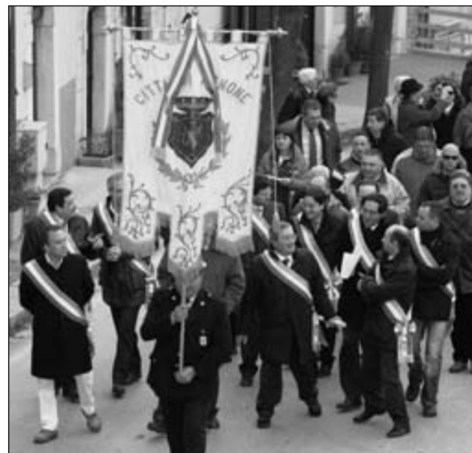
La manifestazione pro Caracciolo dei sindaci altomolisani

"La popolazione già è in esodo verso altre strutture sanitarie proprio perché non si sa se Agnone chiude o meno - afferma il sindaco di Capracotta- Se continua così nonostante le garanzie avute della Asrem, le promesse di dotare Agnone di una eccellenza, di