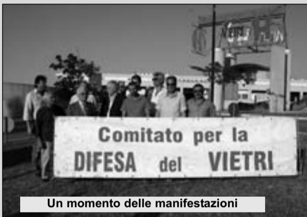
Un momento delle manifestazioni

LARINO. Il Comitato per la difesa dell'Ospedale "G. Vietri" dopo gli articoli di stampa, le varie manifestazioni davanti ai cancelli del presidio sanitario frentano, torna ad invitare la gente, tutti i cittadini del Basso Molise a partecipare ad una nuova manifestazione di protesta da tenersi il prossimo sabato nella centralissima piazza del Popolo. In prossimità delle Elezioni Amministrative Regionali, il Comitato - si legge nella nota inviata alle redazioni giornalistiche regionali - intende, ancora una volta, sensibilizzare l'opinione pubblica sulla ignobile penalizzazione inflitta ad una grande parte della popolazione molisana, privandola dei livelli essenziali di assistenza così come sanciti dalla Costituzione. Non è accettabile e tanto meno logico che si taglino reparti virtuosi ed efficienti per lasciarne di inutili, aumentando il debito e di conseguenza inaspando la tassazione. Non è ricevibile la "storiella" che non possano coesistere due ospedali in questo territorio: il bacino di intervento del capoluogo regionale conta all'incirca lo stesso nume-