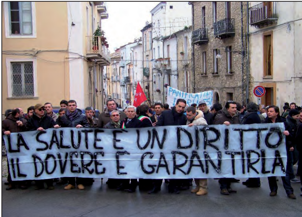
Una delle manifestazioni a favore dell'ospedale «Vietri» di Larino

LARINO. In piazza per difendere l'Ospedale. E' così che il comitato per la difesa (appunto) dell'Ospedale «G. Vietri» di Larino che invita i cittadini del bassomolise a partecipare alla manifestazione di protesta indetta per sabato primo ottobre 2011, a partire dalle ore 9,30 in piazza del Popolo a Larino. «In prossimità delle elezioni amministrative regionali, il Comitato intende, ancora una volta, sensibilizzare l'opinione pubblica sulla «ignobile penalizzazione inflitta ad una grande parte della popolazione molisana, privandola dei livelli essenziali di assistenza così come sanciti dalla Costituzione». «Non è accettabile e tanto meno logico che si taglino repar-