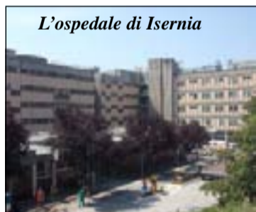
L'ospedale di Isernia

Si svolgerà a partire dalle ore 9 e fino a pomeriggio inoltrato, presso la sala convegni dell'Hotel Sayonara di Isernia, il convegno "Il paziente in ambito cardiovascolare-Gestione infermieristica nella realtà cardiologica molisana", organizzato dall'Anmco Molise-Area Nursing. Riservato prevalentemente agli infermieri, principali relatori dell'incontro, l'evento Ecm affronterà diversi argomenti relativi al nuovo ruolo che l'infermiere ha assunto oggi nei reparti di Cardiologia degli ospedali regionali, valutandone le funzioni svolte sia in ambito clinico che in quello interventistico (emodinamica ed elettrofisiologia). Si tratta, infatti, di un notevole salto culturale, poiché all'infermiere non spetta più un ruolo meramente esecutivo bensì direttamente collaborativo con il medico.