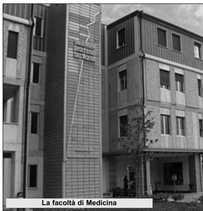
La facoltà di Medicina

CAMPOBASSO. L'Università degli Studi del Molise e la Casa di Cura "Villa Maria" di Campobasso hanno stipulato una convenzione per attività di ricerca e di assistenza. Ieri mattina il Rettore Giovanni Cannata e ha illustrato presso il centro di via Principe di Piemonte i contenuti del protocollo d'intesa. Cuore del progetto è la fattiva collaborazione – teorica ma soprattutto pratica - tra la facoltà di Medicina e Chirurgia dell'ateneo molisano e la rinnovata struttura clinica della Casa di Cura "Villa Maria". "Con questa ulteriore iniziativa - ha spiegato il rettore Cannata - l'Ateneo molisano intende riaffermare l'attenzione verso le strutture territoriali che operano nel campo della salute. E non solo. Infatti rappresenta anche, non solo la continua sollecitudine, considerazione ed impegno nei confronti degli studenti della