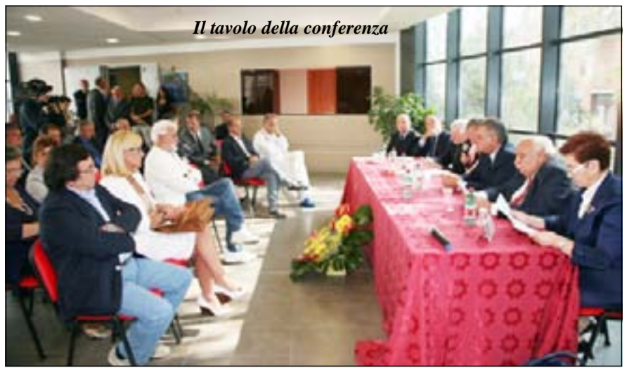
Il tavolo della conferenza