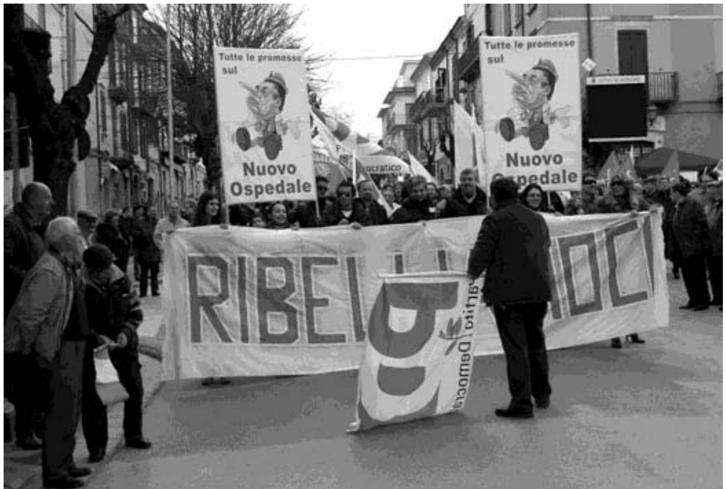
Volantinaggio del Pd che invita la cittadinanza a partecipare alla manifestazione di giovedì prossimo a Campobasso

E intanto cresce l'attesa per l'assise monotematica di mercoledì pomeriggio