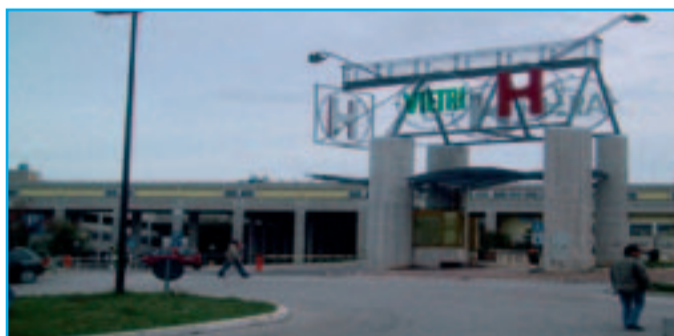
L'ospedale «Vietri» di Larino

UN nuovo grido di allarme giunge dai sei infermieri in forza al pronto soccorso dell'ospedale frentano. Sarebbero notevoli i disagi all'interno del reparto, dovuti principalmente ai turni massacranti a cui sarebbero sottoposti i lavoratori costretti in molte circostanze a rinunciare anche alle ferie maturate. La situazione di grave pericolo per l'utenza è stata denunciata con una lettera indirizzata al direttore generale dell'Asrm, Angelo Percopo. Un primo intervento suggerito dai lavoratori è quello di attingere rinforzi da altri reparti dello stesso ospedale, questo in attesa che venga reperita una nuova unità operativa.