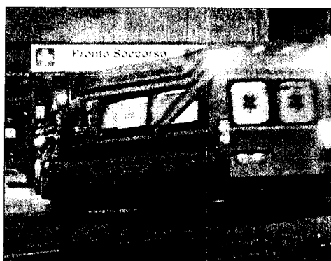
Il pronto soccorso continuerà ad essere operativo anche di notte?

VENAFRO. Non bastava la confusione creata da quanti, da una parte e dall'altra, stanno facendo un evidente "utilizzo" politico della questione, adesso a confondere ulteriormente le idee ai venafrani è giunta anche la nota che l'ufficio stampa della Asrem di Campobasso ha inviato ai media regionali. Decisamente preoccupante il contenuto del comunicato: "Nell'ambito della riorganizzazione della rete ospedaliera regionale la Asrem comunica alla cittadinanza che, a partire da domenica 1 marzo 2009 l'attività di Pronto Soccorso dei presidi ospedalieri "Vietri" di Larino e "Ss. Rosario" di Venafro sarà garantita dalle ore 8,00 alle ore 20,00. Nelle ore notturne il servizio di as-