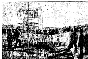
Il presidio davanti al Vietri