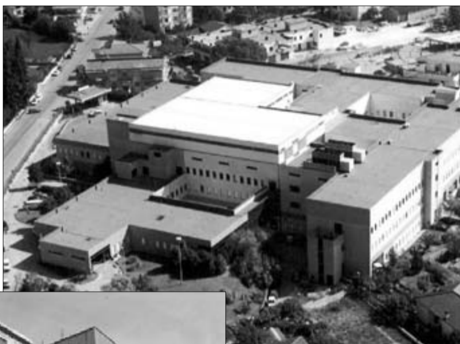
Il "Santissimo Rosario" di Venafro

pur non avendo competenze specifiche in materia di riordino del sistema sanitario, potrà far sentire la sua autorevole voce a sostegno della battaglia che le popolazioni di Venafro e dei centri limitrofi combattono per salvaguardare una istituzione fondamentale per la tenuta economica e sociale dell'intero territorio. E' impor-