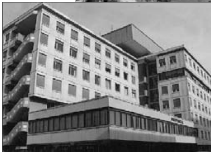
Il palazzo provinciale di Isernia