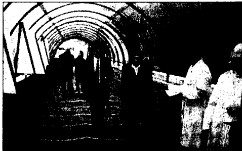
I volontari dell'Avo distribuiscono materiale all'ingresso dell'ospedale di Isernia per informare i cittadini

ISERNIA. Sono quelli vestiti con un camice bianco che si avvicinano ai malati soli negli ospedali e gli rivolgono una parola, restando lì ad ascoltarli ed assisterli. Questi è ciò che fanno quotidianamente gli iscritti all'Avo, l'Associazione Volontari ospedalieri.