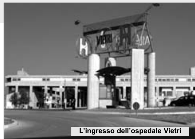
L'ingresso dell'ospedale Vietri

Come diceva un fine intenditore di manovre e di inciuci "pensare male è un peccato ma spesso si coglie la verità".