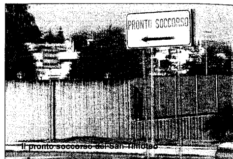
Il pronto soccorso del San Timoteo

le, la 548 dello scorso 15 maggio e la successiva nota del 29 maggio del manager Florio in cui, tra le altre cose, sono state adottate disposizioni "per garantire il servizio di emergenza territoriale regionale con personale medico abilitato al servizio e tra queste appunto quella relativa allo svolgimento dell'attività di trasferimento protetto interospedaliero di pazienti acuti". Ebbene di fronte alle carte, alle disposizioni messe nero su bianco, due opinioni diverse, quella del medico del pronto soccorso convinto della possibilità del trasferimento della piccola con l'ambulanza del 118 e quella della centrale operativa di Campobasso che soltanto dopo un'ora, dopo telefonate incrociate con il responsabile del Set-118 ha dato l'ok al trasferimento. Una storia fortunatamente a lieto fine per la piccola, ma che è l'ulteriore dimostrazione di come stanno andando le cose nella sanità molisana e, non soltanto quella bassomolisana. Perché se il Vietri deve continuare ad esistere, deve