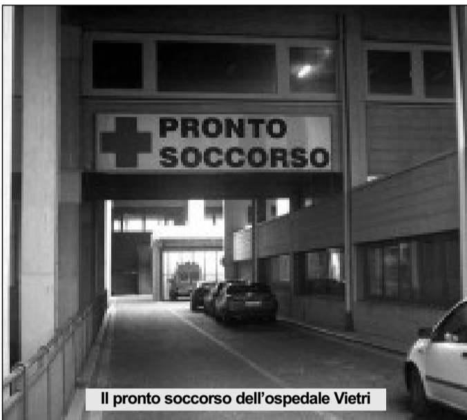
Il pronto soccorso dell'ospedale Vietri

potrebbe verificarsi sull'emergenza territoriale e 118 che sarebbe attivato per richieste improprie costituite essenzialmente di codici bianchi poi trasferiti presso i pronto soccorsi ospedalieri già oberati di lavoro con allungamento dei tempi di attesa per le patologie più gravi. Insomma il solito cortocircuito che manda in tilt il sistema dell'emergenza. Tale prospettiva è in netto contrasto con la programmazione regionale e delle direttive nazionali che prevedono una forte riconversione del Ssn verso la medicina territoriale e di prossimità che riesce a valorizzare al meglio le esigue risorse a disposizione. Esprimiamo totale dissenso totale alla chiusura di sedi di guardia medica in quanto la particolare situazione orografica, viaria e di antropizzazione della regione Molise non consentirebbe di garantire i Lea (Livelli essenziali di assistenza) con grave pericolo per la salute dei cittadini residenti nei piccoli comuni e determinerebbe una gravissima ricaduta occupazionale per i medici di continuità assistenziale non titolari di incarico a tempo indeterminato nella più assoluta convinzione che tale taglio non porterebbe alcun beneficio al bilancio regionale".