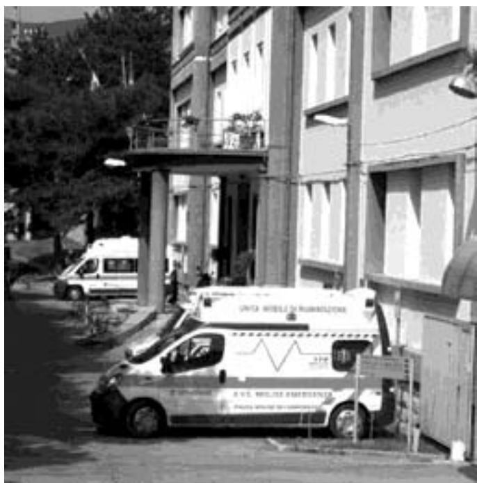
Ospedale, il gruppo Nuovo Sogno Agnonese incontra il personale

«Nuovo Sogno Agnonese» domani incontra medici e infermieri