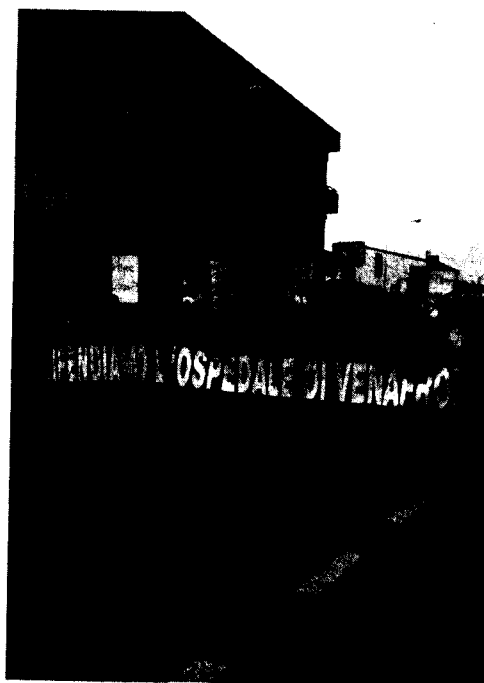
La prima protesta contro i tagli al Santissimo Rosario