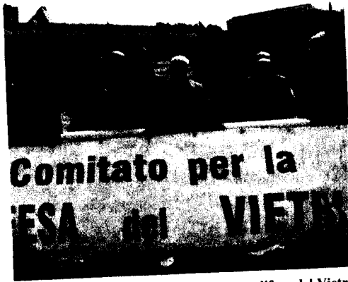
La manifestazione del comitato civico a difesa del Vietri