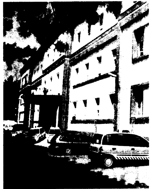
L'ospedale San Francesco Caracciolo di Agnone