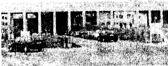
Vietri Non si placano le polemiche sulla riforma della sanità