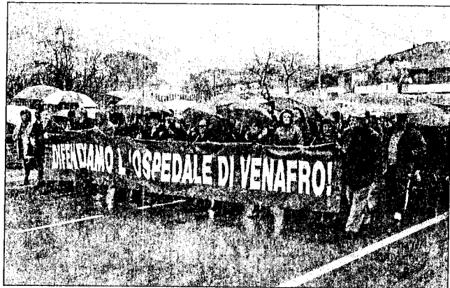
Annullata la manifestazione popolare in programma per sabato prossimo

VENAFRO. Annullata la manifestazione popolare in programma per la mattina di sabato prossimo. A comunicarlo sono direttamente i vertici del Comitato civico "Pro Venafro", i quali avevano invitato i venafрани alla protesta pubblica in ragione della chiusura notturna del pronto soccorso. "Considerato -fanno presente dal Comitato- che il 5 marzo con prot. 157 è arrivata una comunicazione della Direzione Generale che di fatto lascia al Santissimo Rosario la dignità di essere ancora definito Ospedale; visto che tutti hanno monitorato lo sviluppo della situazione con passi politici e tecnici tanto da giungere a un esito positivo per la sopravvivenza dello stesso Ospedale; per noi non esistono più le condizioni per una mobilitazione di piazza, avendo pienamente raggiunto gli obiettivi prefissati nel nascere: la salvaguardia del Santissimo Rosario". Queste le motivazioni, quindi, che hanno indotto i vertici del Comitato ad annullare la manifestazione popolare in programma per sabato prossimo. Non solo, dalla stessa nota si apprende che: "Alla luce