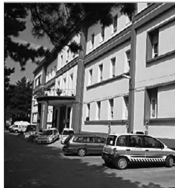
L'ospedale Caracciolo Agnone

tre alle comunicazioni del primo cittadino, il consiglio convocato per le ore 16,30, dovrà analizzare il da farsi in merito al piano di rientro per il recupero del deficit economico-finanziario e sulla paventata razionalizzazione dei servizi socio-sanitari nell'ambito distrettuale di Agnone. Infine la manifestazione targata Il Cittadino C'è che avrà luogo a Campobasso dopodomani. L'8 aprile a Iorio verranno consegnate quattromila firme. Sarà presentata la "provocatoria" lettera di dimissioni di tutti i sindaci dei comuni dell'alto Molise e di quelli Abruzzesi che s'appoggiano, per il diritto alla salu-