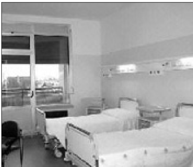
Una camera di un country Hospital

A Colletorto, invece, sarà realizzata una Rsa (Residenza sanitaria assistenziale). In totale sono 118 i posti letto a disposizione di cui 58, cosiddetti "tecnici". L'obiettivo è quello di curare i pazienti con malattie acutizzate o croniche diret-