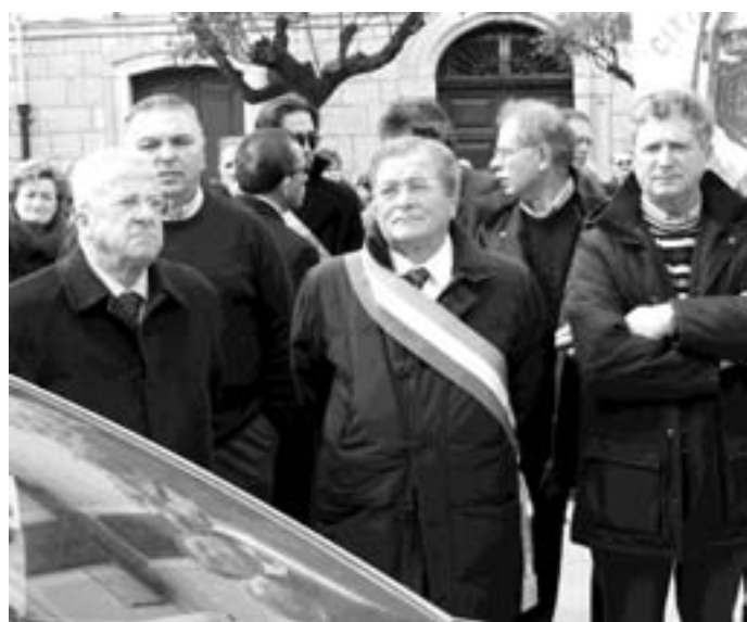
La protesta di Agnone dove presero parte diciotto sindaci

pre fiore all'occhiello della sanità regionale, ragione per cui bisogna avere il coraggio di tramutare in azioni concrete le parole di propaganda che, poche settimane fa, si sono spifferate ai quattro venti. Se davvero l'ospedale è destinato ad essere smantellato reparto dopo reparto, posto letto dopo posto letto e i primi cittadini non terranno fede al gravoso impegno preso dinanzi alla stampa, alle televisioni e a mille persone, questa sorta di ignavia segnerà non soltanto la morte politica dei sindaci firmatari, ma di tutto il nostro territorio. Infatti concludono -, tanto per citarne due, come potremo mai pretendere l'applicazione della legge della montagna o i soldi dei Pit se adesso, nelle ore cruciali di questa battaglia per la sopravvivenza, la politica locale rimarrà inerte?»