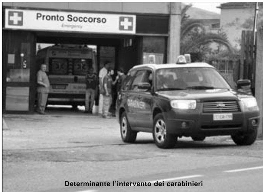
Determinante l'intervento dei carabinieri

VENAFRO. Un episodio gravissimo quello consumatosi nel pomeriggio di ieri a Venafro. Erano le 18 quando i carabinieri della locale Stazione sono intervenuti in soccorso di un padre di famiglia che, a bordo della sua utilitaria, correva disperatamente in direzione dell'ospedale "Santissimo Rosario", in quanto il figlioletto di soli 31 giorni aveva perso i sensi in conseguenza di una grave crisi respiratoria. Grazie all'efficienza dei militari, che si sono resi immediatamente conto della gravità della situazione e non hanno esitato un istante a fare da "apripista" con le sirene spiegate, in pochi minuti il bimbo è giunto al pronto soccorso. L'impegno dei carabinieri, però, ha rischiato di essere vanificato da quanto successivamente accaduto al nosocomio venafrano. Nell'impossibilità di affrontare la delicata situazione, i pur bravissimi sanitari del "Santissimo Rosario", hanno tentato per ben due ore di trasferire il bimbo presso strutture limitrofe meglio attrezzate. Richieste accorate sono state inoltrate in tutto il centro Italia, fino agli ospedali di Roma, ma nessuna struttura si è messa a disposi-