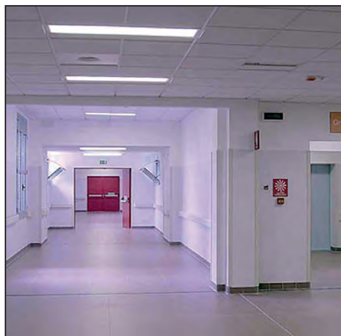
Il comitato in difesa dell'ospedale di Larino resta cauto sulla notizia della creazione del nuovo reparto

Il tentativo "maldestro" di riordino della sanità molisana, legato ad una scellerata gestione clientelare, ha di fatto calpestato i diritti essenziali di assistenza sanitaria (LEA) dei cittadini residenti nelle aree interne del nostro Molise. Il Comitato pro Vietri ha ripetutamente denunciato i pericoli di questa riorganizzazione, come quando è intervenuto per scongiurare la già programmata chiusura del reparto di medicina, determinando il ricovero di pazienti che giacevano per ore nell'astanteria del Pronto Soccorso in assenza di po-