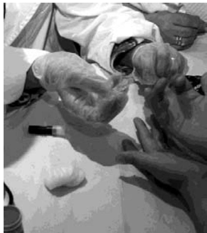
Diabetologia ed endocrinologia: pazienti preoccupati

A breve partirà la petizione tra gli oltre 20 mila pazienti affetti da tali patologie seguiti presso le strutture ospedaliere pubbliche di Endocrinologia, Diabetologia e malattie metaboliche della regione.