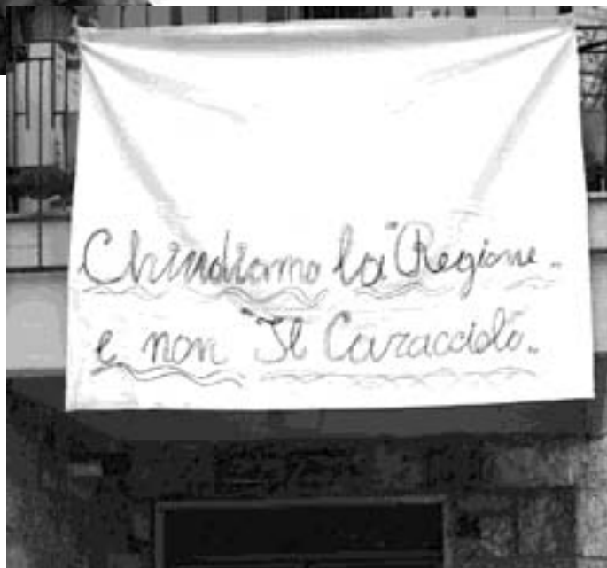
L'alto Molise sceso in piazza a difesa del «Caracciolo»

«Nella maniera più assoluta non si tratta di questo - precisano - la no-