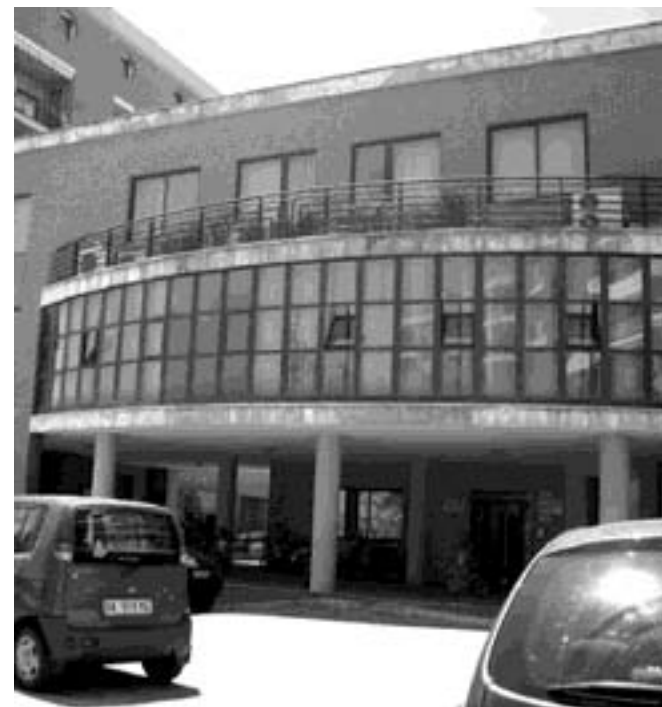
La sede di Campobasso del centro di riabilitazione

Nel fine settimana si è tenuta una riunione, presso l'assessorato regionale al Lavoro della Regione Abruzzo a cui hanno partecipato, tra gli altri, i rappresentanti del 'Neuromed' che hanno illustrato il piano generale. Un piano che prevede l'intervento diretto con una nuova società partecipata al 100% dal Neuromed per l'affitto delle aziende in funzione e del successivo acquisto, nell'ambito di una procedura di concordato preventivo in fase di presentazione da parte del Gruppo Angelini. Ribadita la volontà del mantenimento dei livelli occupazionali.