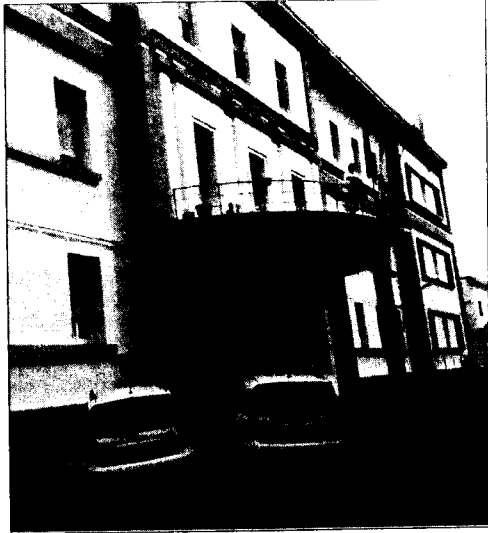
L'ospedale di Agnone

Ma niente di tutto questo accadrà questa mattina ad Agnone. Il subcommissario, infatti, arriverà alle ore 11:30 al San Francesco Caracciolo e illustrerà a medici, personale ed amministratori del presidio il nuovo Patto per la Salute, promosso dal governo centrale. Il Patto per la Salute è un accordo fi-