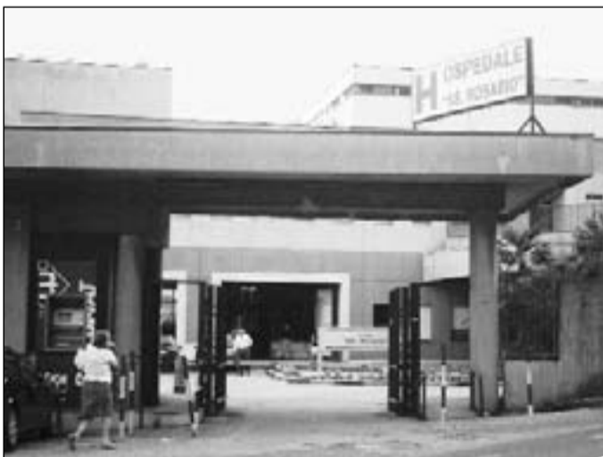
L'ingresso del "Ss. Rosario"

Via Alfieri, 69 (Trav. Via Colonia Giulia) - Galleria Vittoria - 86079 Venafro (IS) - Tel. 0865 904738-902797 - Fax 0865 904759 E-mail: venafro@primopianomolise.it