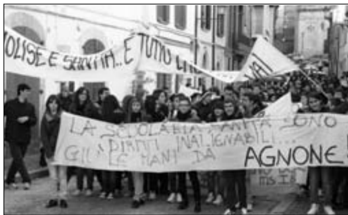
Il corteo. In basso, a destra, il sit in davanti al Caracciolo

Un sit-in proprio lungo il corso (fatto immediatamente sgombrare dalle Forze dell'Ordine) poi il raduno sul prato della villa comunale. Infine un corteo silenzioso “nel rispetto dei malati ricoverati –afferma uno studente–” sotto il San Francesco Caracciolo e qui ancora tutti seduti davanti la porta d'ingresso del Presidio Ospedaliero. Cori e canti; slogan di protesta. Sibili di fischietti come sottofondo. Ed anche qualche petardo: boati che hanno scosso la tranquillità della cittadina. Gli studenti (circa quattrocento dei tre istituti superiori) hanno chiesto a gran voce “sicurezza per il futuro; garanzia della sanità e man-