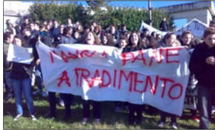
Il sit in davanti al Caracciolo e alcuni striscioni esposti dagli studenti durante la manifestazione organizzata ieri mattina