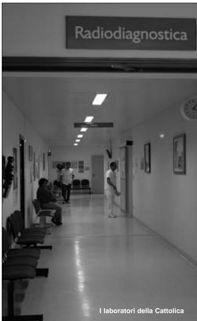
I laboratori della Cattolica

All'interno del centro sportivo M2 è stato creato un laboratorio di osservazione