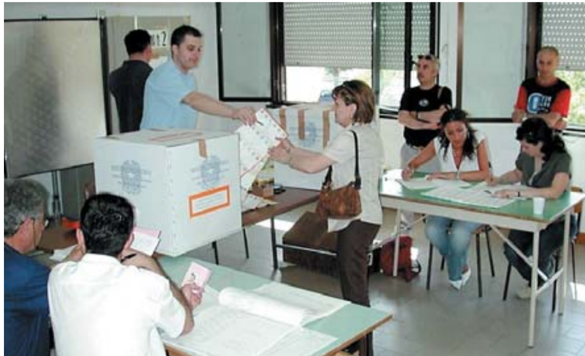
Elezioni Attesa per il ritorno alle urne di novembre

Sono rappresentati dalla «rabbia» per gli ospedali e dall'assuefazione al successo