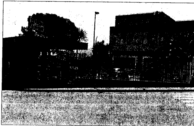
Incertezza sul futuro dell'ospedale

lazione del Venafrano e dell'Alto Casertano che gravita su Venafro. Una cifra, se tale, bassissima. E, pur ipotizzando una ripresa alla grande delle firme in questi primi giorni del 2009 e quindi un picco delle adesioni, comunque un'adesione popolare contenuta rispetto alle previsioni. Quali i motivi? Sfiducia verso la classe politica regionale? Scoramenco dei venafrani? Loro assuefazione a perdite e tagli, ripensando a tanti episodi passati (vedi l'allora Sanatrix, la Pretura e gli stessi reparti di Pediatria e Ginecologia del Ss. Rosario e quant'altro)? O, peggio ancora, relativa fiducia verso l'attuale Ss. Rosario e i suoi servizi, soprattutto per le persistenti deficienze strutturali? Difficile dirlo, e delicatissimo entrare nel merito del discorso. Anche se, per obiettività d'informazione e nonostante la consapevolezza di affrontare possibili contrarietà in loco, il cronista deve riferire dello stato d'abbandono e degrado che contraddistingue tanta parte esterna del nosocomio venafrano, nonché taluni ambienti all'interno del Ss. Rosario. E' il caso dei ma-