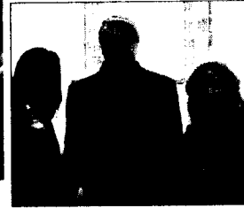
Le immagini della giornata 'romana'