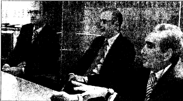
Gli avvocati che hanno seguito il caso dell'infermiera e della sua bambina

Era il 1991. La donna, infermiera di una struttura ospedaliera molisana, si punge con una siringa usa-