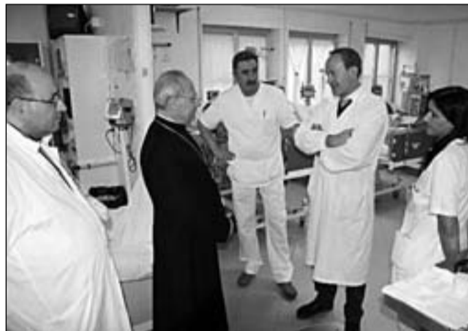
I momenti del Precetto Pasquale al San Francesco Caracciolo

un incontro con i primari ospedalieri i quali hanno esternato al loro Pastore tutte le perplessità esistenti sul mantenimento del Caracciolo. "Non è concepibile un ospedale di sole targhette -hanno affermato i camici bianchi dell'ospedale agnonese- Il Caracciolo deve restare un ospedale che dovrà mantenere servizi funzionanti, sicuri, efficienti e con le dotazioni al cento per cento". Da quanto si sa il Vescovo sta lavorando in silenzio e con discrezione. Il Presule Triventino ha incontrato infatti nella