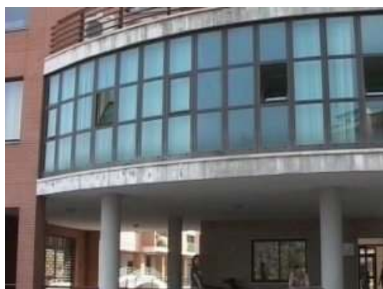
La sede di San Stef.Ar in via Campania

La vicenda San Stef.Ar diventa sempre più complicata. Aspettando l'emanazione del bando per l'assegnazione della gestione del centro ecco che arriva un'altra batosta . Lo sfratto. Entro dieci giorni i lavoratori dovranno lasciare la sede di via Campania..