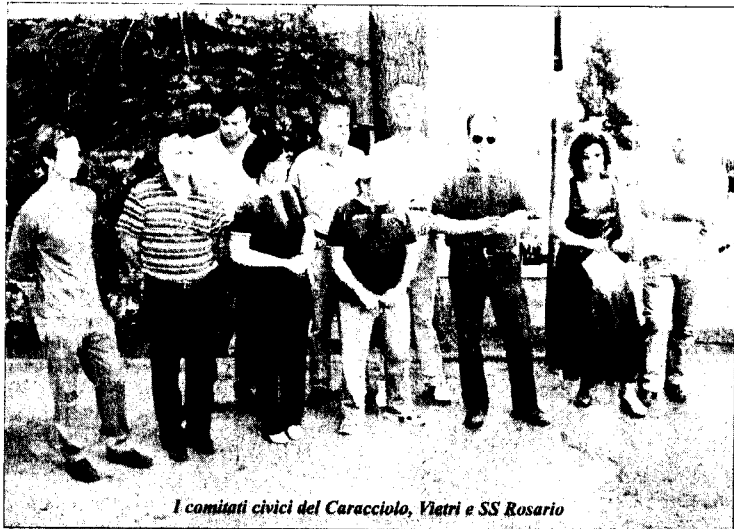
I comitati civici del Caracciolo, Vietri e SS Rosario

Cresce la mobilitazione in difesa del Caracciolo, Vietri e SS Rosario che verranno ridimensionati dalla Regione