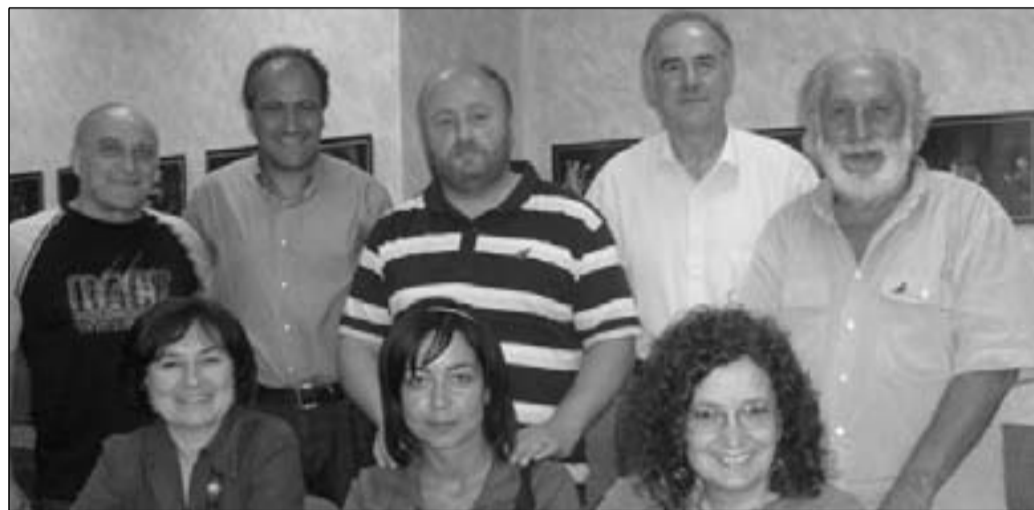
I rappresentanti dei comitati che lottano per salvare gli ospedali di Agnone, Larino e Venafro