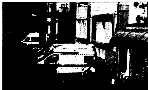
Il San Francesco Caracciolo

ché potrebbe affrontare con nuovi strumenti una parte del problema sanitario regionale ed inoltre in qualità di eventuale partner della società beneficerebbe anche economicamente dell'aumento di efficienza derivante da un approccio privatistico. 2) L'Asrem che in qualità di committente potrebbe "usare" il Caracciolo come una sorta di ammortizzatore sanitario nel caso di esigenze particolari (ad esempio nel caso di liste d'attesa lunghe o di mobilità passiva per talune specialità potrebbe chiedere al Caracciolo di garantirle). 3) Il tavolo tecnico romano che in realtà chiede, a voce alta, maggiore efficienza. 4) Gli altomolisani a cui sta a cuore l'erogazione puntuale e corretta delle prestazioni e ciò sarebbe garantito, fermo stando che una tale esperienza