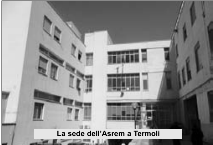
La sede dell'Asrem a Termoli

Il virus di stagione comincia a interessare una parte consistente della popolazione