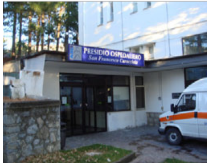
L'ingresso del San Francesco Caracciolo di Agnone

Sono stato uno dei promotori del ricorso al Tar e, oggi come ieri, non ho intenzione di abbassare la guardia sul