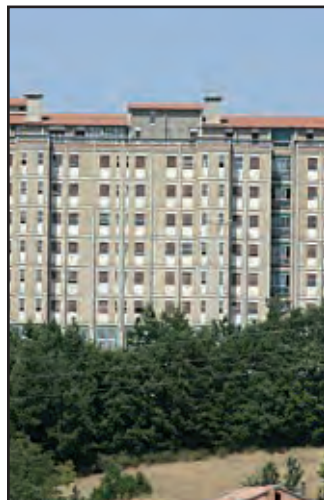
L'ospedale Cardarelli di Campobasso