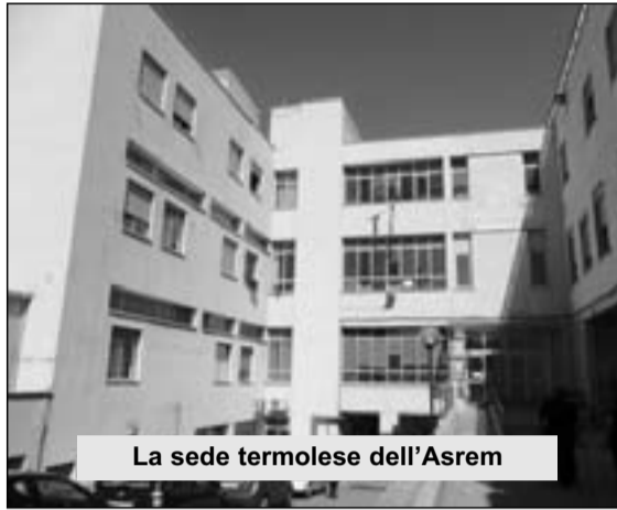
La sede termolese dell'Asrem

'analisi cortisolo urinario delle 24', così come prescritto dal medico di base. "Abbiamo fatto la prenotazione all'ex ospedale e pagato il ticket- ha raccontato il signore- quindi abbiamo fatto recapitare le urine al personale sanitario che ci ha detto di attendere quindici giorni prima di andare a ritirare le