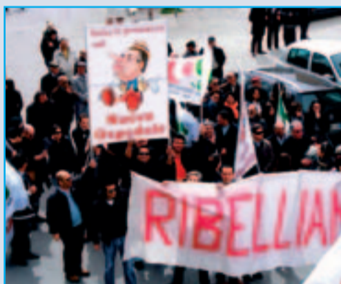
Un momento emblematico della protesta per salvare il Caracciolo di Agnone

Soltanto ieri mattina i consiglieri regionali e i cittadini molisani hanno potuto conoscere la bozza predisposta dal Commissario Iorio per la ristrutturazione del sistema sanitario molisano. Dei sei ospedali attualmente in attività ne resteranno aperti solamente tre. Caracciolo, Vietri e Ss. Rosario verranno declassati al ruolo marginale di poliambulatori o poli specialistici. Cadono così le rassicurazioni propagandate da mesi da Michele Iorio.