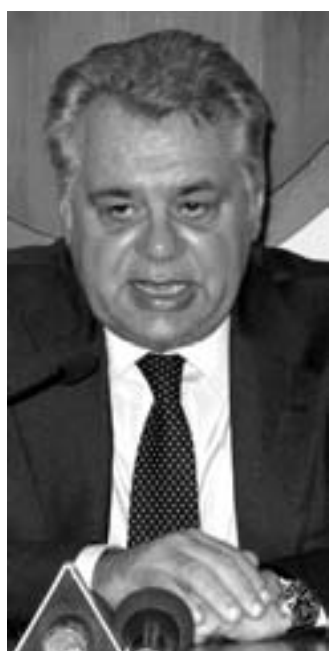
Il Commissario Iorio, autore della bozza

Probabilmente qualche mandolinista regionale adesso si affretterà a contrabbandare quella che appare una vera e propria spoliatura per un avanzamento di grado e prestigio. Scenderanno in campo i lanzichenecchi che, bravi mercenari, andranno sul territorio a spiegare che da tutto questo Larino, Agnone e Venafro ci guadagnano.