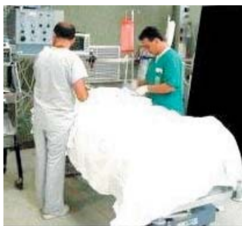
Primari Secondo il sito Asrem ricevono in vari casi premi aggiuntivi per la qualità

Brunetta Il Ministro ha chiesto di non essere troppo generosi nel valutare positivamente le prestazioni di chi ha già emolumenti «corposi»