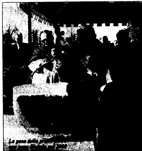
La posa della struttura

"Al di sotto di un certo numero di tagli la struttura non può sopravvivere"