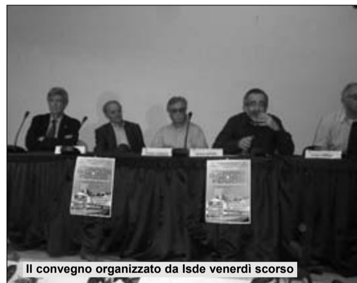
Il convegno organizzato da Isde venerdì scorso