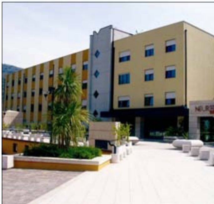
Nella foto la Neuromed

“Per noi – ha detto - le priorità sono la salvaguardia dei posti di lavoro e delle professionalità espresse dai dipendenti della SanStefar e la qualità dei servizi offerti ai pazienti, e tutto