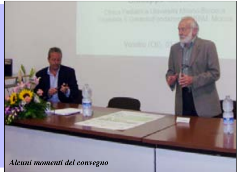
Alcuni momenti del convegno

Informazioni corrette tra gli strumenti indispensabili per educare la popolazione e sensibilizzarla sui temi della tutela ambientale