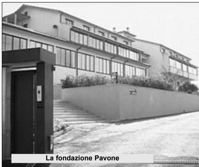
La fondazione Pavone