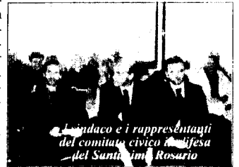
sindaco e i rappresentanti del comitato civico in difesa del Santissimo Rosario

Intorno a questo polo - ha proseguito Di Giacomo - dobbiamo inserire un centro regionale per le malattie degenerative a carattere neurologiche e dobbiamo impegnarci per assicurare la rianimazione". Le parole di Di Giacomo e Passarelli hanno soddisfatto sia gli esponenti del comitato che i consiglieri provinciali. Tanto che è stato redatto e approvato un documento con il quale si impegna il commissario, il sub commissario e la Regione ad agire sul riordino del sistema sanitario tenendo conto delle proposte dei due esponenti politici.