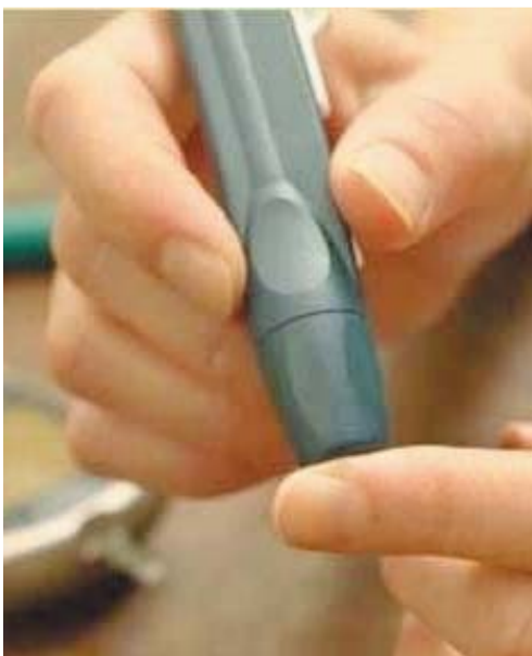
Valori Verranno misurati a fini preventivi

■ Analisi del sangue gratuite da ieri al 13 marzo prossimo a Termoli ed a Larino nell'ambito della settimana della prevenzione del diabete.