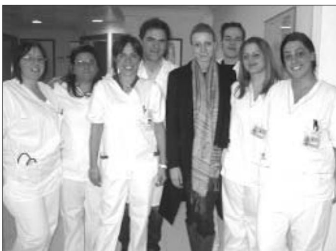
POZZILLI. Charlene Lynette Wittstock, ex-nuotatrice agonistica sudafricana e da 4 anni compagna di Alberto II di Monaco, ieri è stata in vi-

sita all'Istituto Neurologico Mediterraneo Neuromed di Pozzilli. Da sempre attenta ai temi della salute e del benessere la Wittstock, ricordata