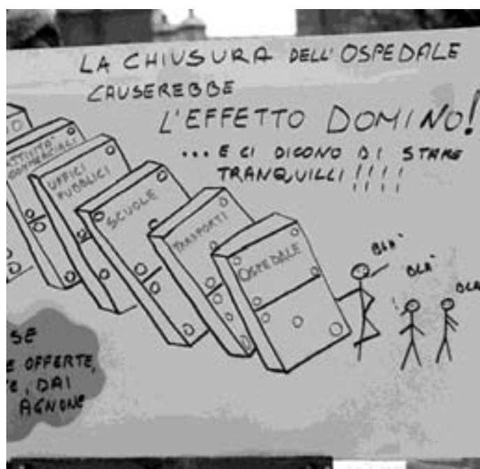
Un cartello affisso al gazebo della manifestazione di domenica

pobasso, Isernia, Termoli, Venafro). Dal canto suo, Agnone si è vista sfilare sotto il naso la sede della seconda provincia, sottrarre il tribunale e, più di recente, anche la scuola infermieri. La nostra rete viaria è quella che, in regione, ha subito le minori modifiche negli ultimi 30 anni: sono stati necessari circa 40 anni per realizzare una parte della Fondo-Valle Verrino (che non proseguirà mai verso l'area del Sangro) e della Fondo Valle Vella si parla come di una chimera e resterà per sempre un miraggio. Nonostante un retaggio storico-culturale unico in tutto il Mezzogiorno, nonostante una delle biblioteche migliori e più antiche della regione, nonostante un patrimonio ambientale e architettonico invidiato da molte parti d'Italia, Agnone, l'Atene del Sannio, si è sempre vista negare una sede dell'università (nonostante i proclami del mantellato