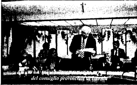
del consiglio provinciale di Isernia

L'ospedale di Venafro non chiuderà ma verrà riorganizzato puntando sui reparti d'eccellenza che già si trovano al loro interno. Verrà inoltre potenziato uno dei servizi ritenuto indispensabile per il corretto funzionamento dei due nosocomi, ossia, il Pronto soccorso. Lo hanno dichiarato nel corso del Consiglio provinciale svoltosi questa mattina sul riassetto del sistema sanitario provinciale l'assessore alla Sanità, Nicola Passarelli e il senatore Ulisse Di Giacomo, membro della Commissione Sanità al Senato. I due esponenti politici hanno anche sottolineato come non siano assolutamente intenzionati, assieme al presidente della Regione Molise Michele Iorio a permettere che i due ospedali vengano chiusi dal Governo o che vengano fortemente ridimensionati. A invitare i due esponenti politici in Consiglio provinciale è stato il presidente, Luigi Mazzuto, che in questo modo ha voluto contribuire a fare chia-