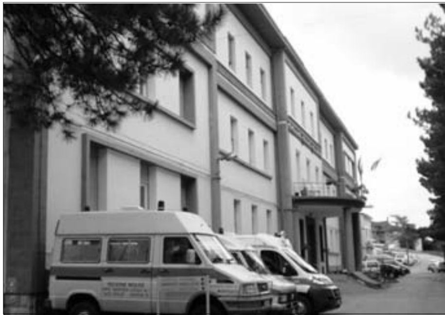
Sindaci e clero mobilitati in difesa del "Caracciolo"