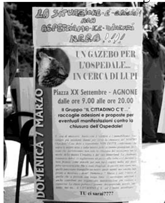
La piazza insorge contro eventuale ridimensionamento dell'ospedale

Domenica è stato presente in piazza XX Settembre