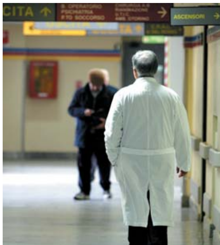
Le cause Legate anche all'invecchiamento della popolazione

Rivelano un incremento delle patologie tra i 50 e i 60 anni