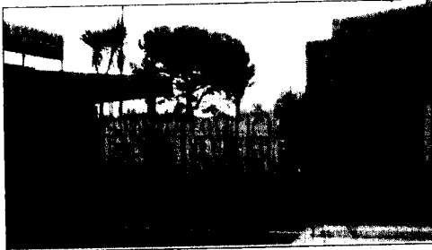
Striscioni all'esterno dell'ospedale