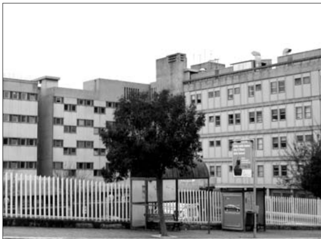
L'ospedale "F. Veneziale" di Isernia