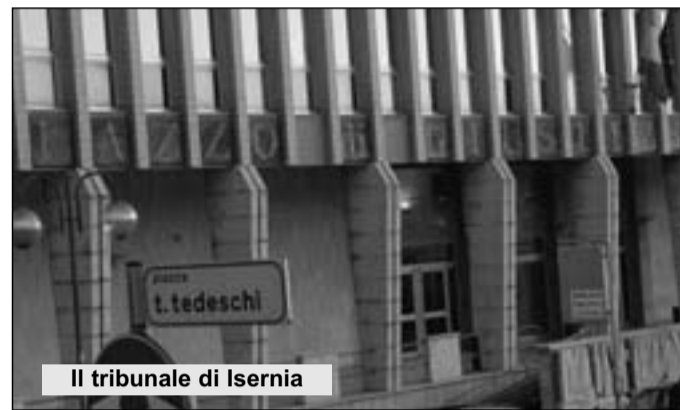
Il tribunale di Isernia

Sottosegretario del- l'Ospedale Venezia-