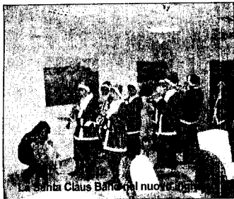
Santa Claus Band nel nuovo ingresso