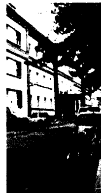
Il San Francesco Caracciolo

«Cosa farò dal 1° gennaio? Spero di stare bene in salute e resto a disposizione»