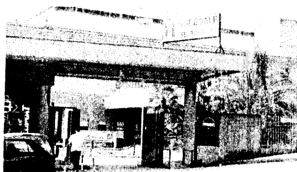
Venafro La sede dell' ospedale SS Rosario