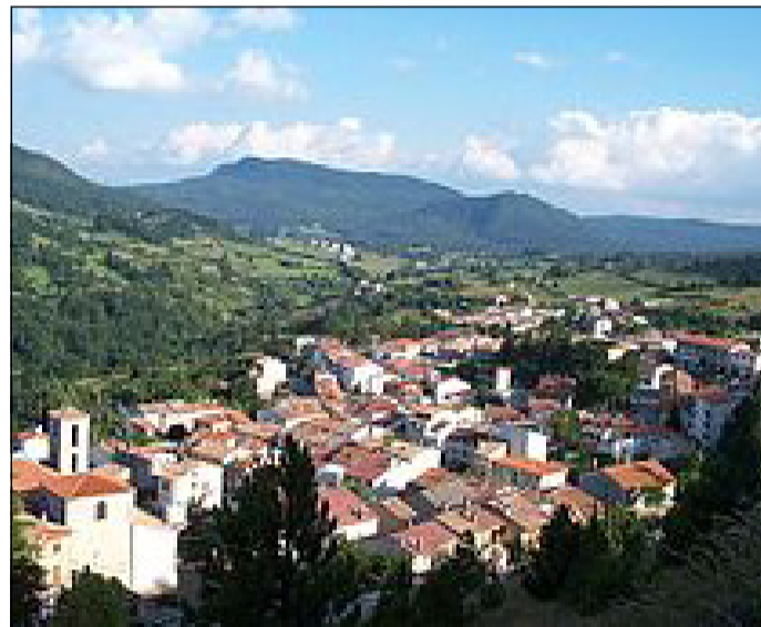
San Pietro Avellana