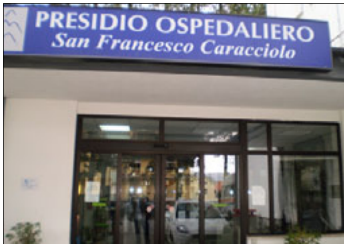
L'ingresso del San Francesco Caracciolo

AGNONE. Mese di marzo positivo per il Caracciolo con un'ascesa in tutte le attività, chirurgiche comprese. Anche la ginecologia ha avuto un ritorno di ricoveri e di interventi. Torna la tranquillità ed una certa fiducia verso un ospedale che resta e che non viene azzerato, anzi che verrà ridisegnato come vero "ospedale di montagna" così come promesso dall'assessore alla sanità Di Sandro e come negli intenti della IV Commissione regionale che stamani, proprio sull'argomento incontrerà i sindacati mentre domani avrà un con-