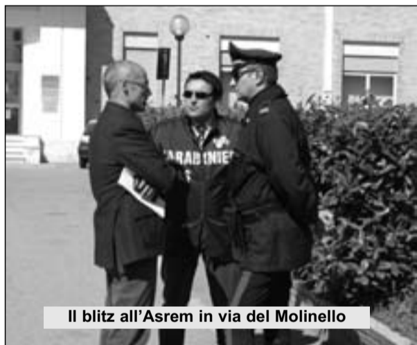
Il blitz all'Asrem in via del Molinello

esclusivamente ad una “rottura fisica” dell'hard disk del server su cui era installata la procedura delle presenze del personale dell'Asrem zona Termoli-Larino. E' dunque assolutamente improprio parlare di sabotaggio o manomissione anche perché il guasto si è verificato il 7 marzo 2012 cioè, 10 giorni prima del controllo dei Nas, avvenuto il 15 marzo 2012. Nonostante il guasto tecnico i dati relativi al personale della zona Termoli-Larino dell'Asrem” sono disponibili”.