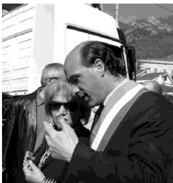
Maggioranza al Comune di Venafro, estromessa l'Udc